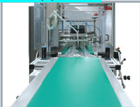
Particolare del nastro di carico. Conveyor belt detail.