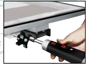
Perillas de tensión rápida

El marco de la pantalla y la base giratoria son opcionales